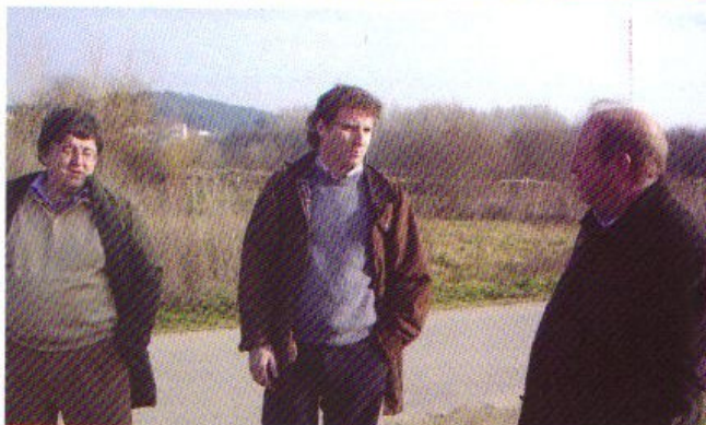
El último día los visitantes pudieron comprobar "in situ" el desarrollo que han experimentado los viveros de plantas ornamentales en Galicia.